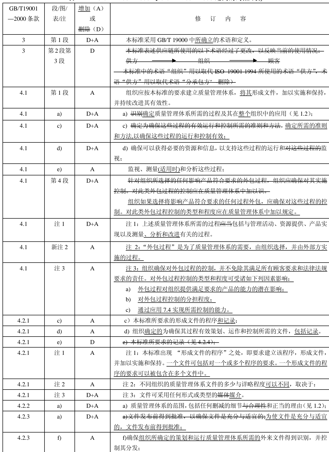
表 B.1 - GB/T 19001-2000 与 GB/T 19001-2008 之间的对照 (续)